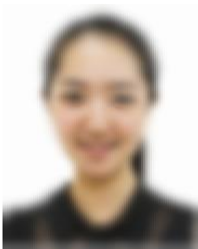
证件照标准示例照片