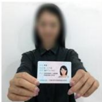
手持身份证照片示例